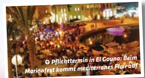
☉ Pflichttermin in El Gouna: Beim Marinafest kommt mediterranes Flair auf

Jeden Dienstag und Freitag wird die Marina zum Festivalgelände. Dann strömen Gäste aus allen Hotels in die Abu Tig Marina, um den Musikdarbietungen zu lauschen oder Barbecues und Shishas zu fröhnen. In El Gouna gibt es sogar Nachtleben mit Diskotheken und Bars.