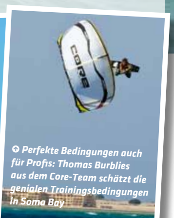
☺ Perfekte Bedingungen auch für Profis: Thomas Burbles aus dem Core-Team schätzt die genialen Trainingsbedingungen in Soma Bay