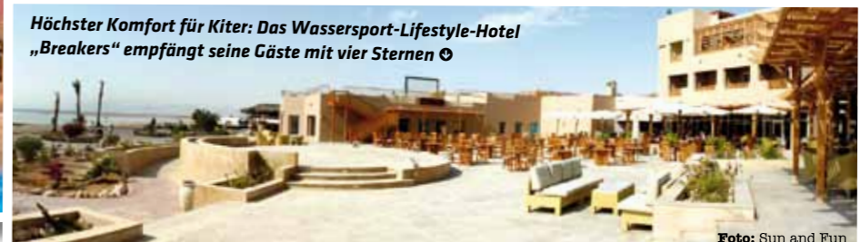
Höchster Komfort für Kiter: Das Wassersport-Lifestyle-Hotel „Breakers“ empfängt seine Gäste mit vier Sternen ☺