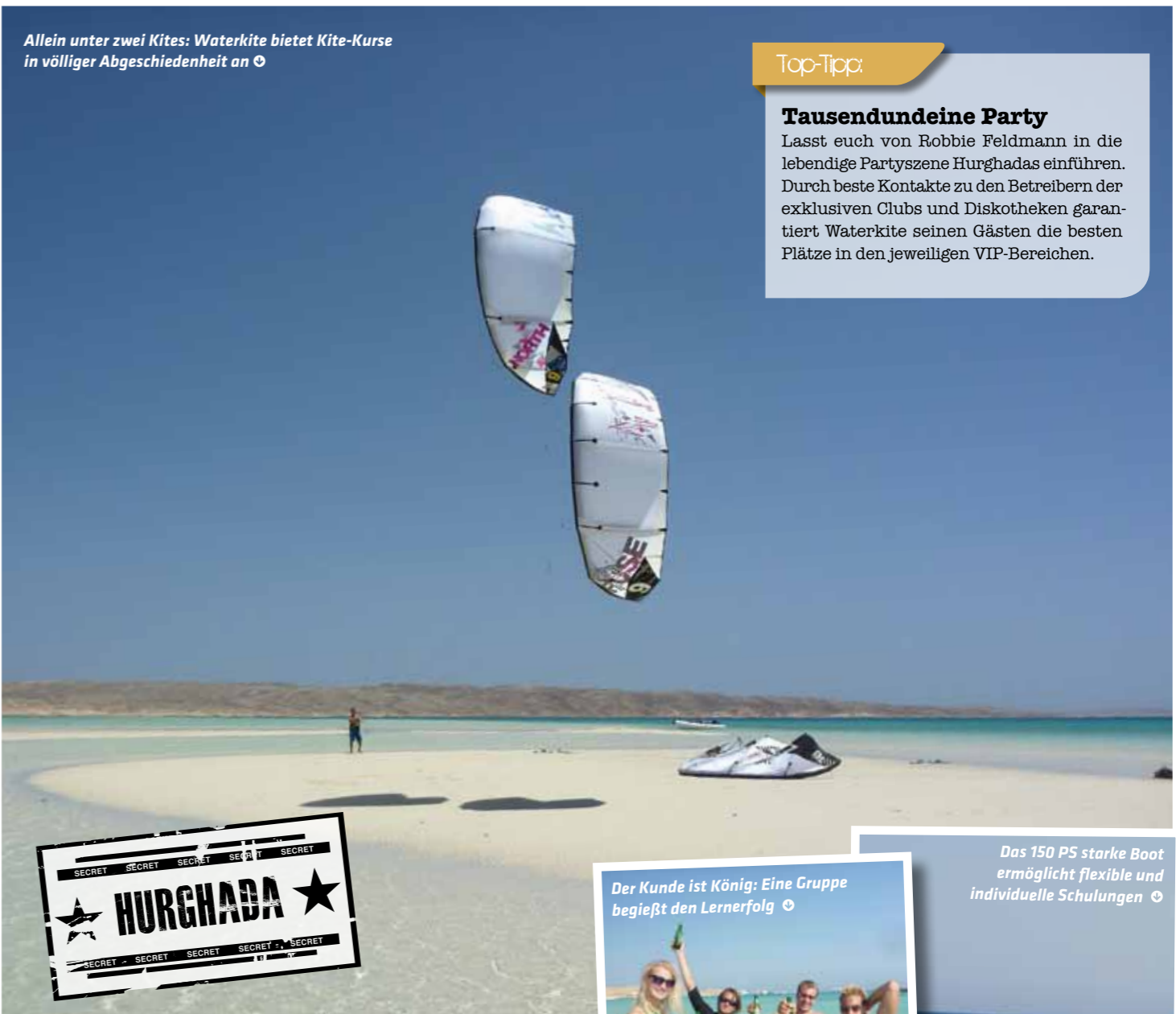
Allein unter zwei Kites: Waterkite bietet Kite-Kurse in völliger Abgeschlossenheit an ☺