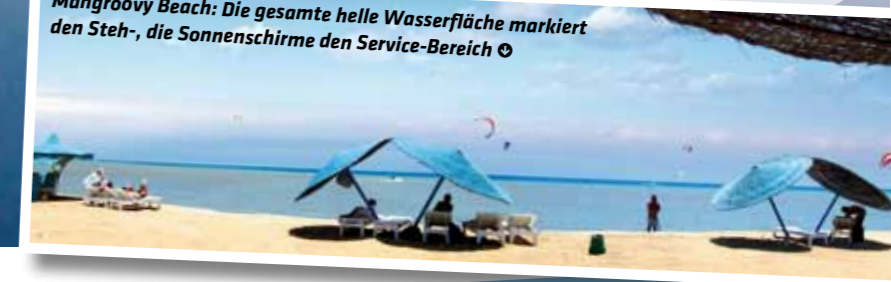
Mangroovy Beach: Die gesamte helle Wasserfläche markiert den Steh-, die Sonnenschirme den Service-Bereich ☉

Buchung: www.sunandfun.de www.ola-sportreisen.de