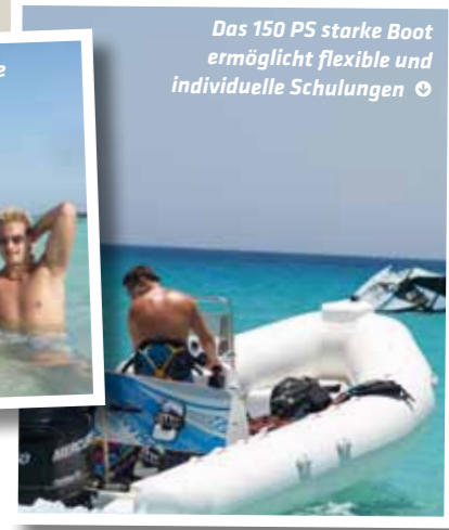
Das 150 PS starke Boot ermöglicht flexible und individuelle Schulungen ☺