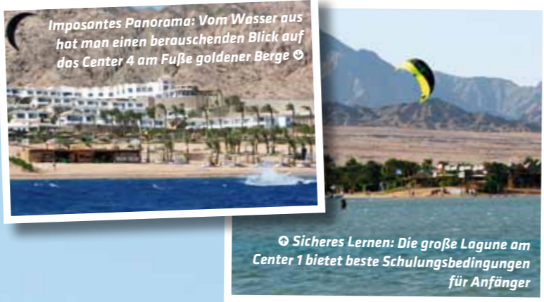
Imposantes Panorama: Vom Wasser aus hat man einen berausenden Blick auf das Center 4 am Fuße goldener Berge ☺