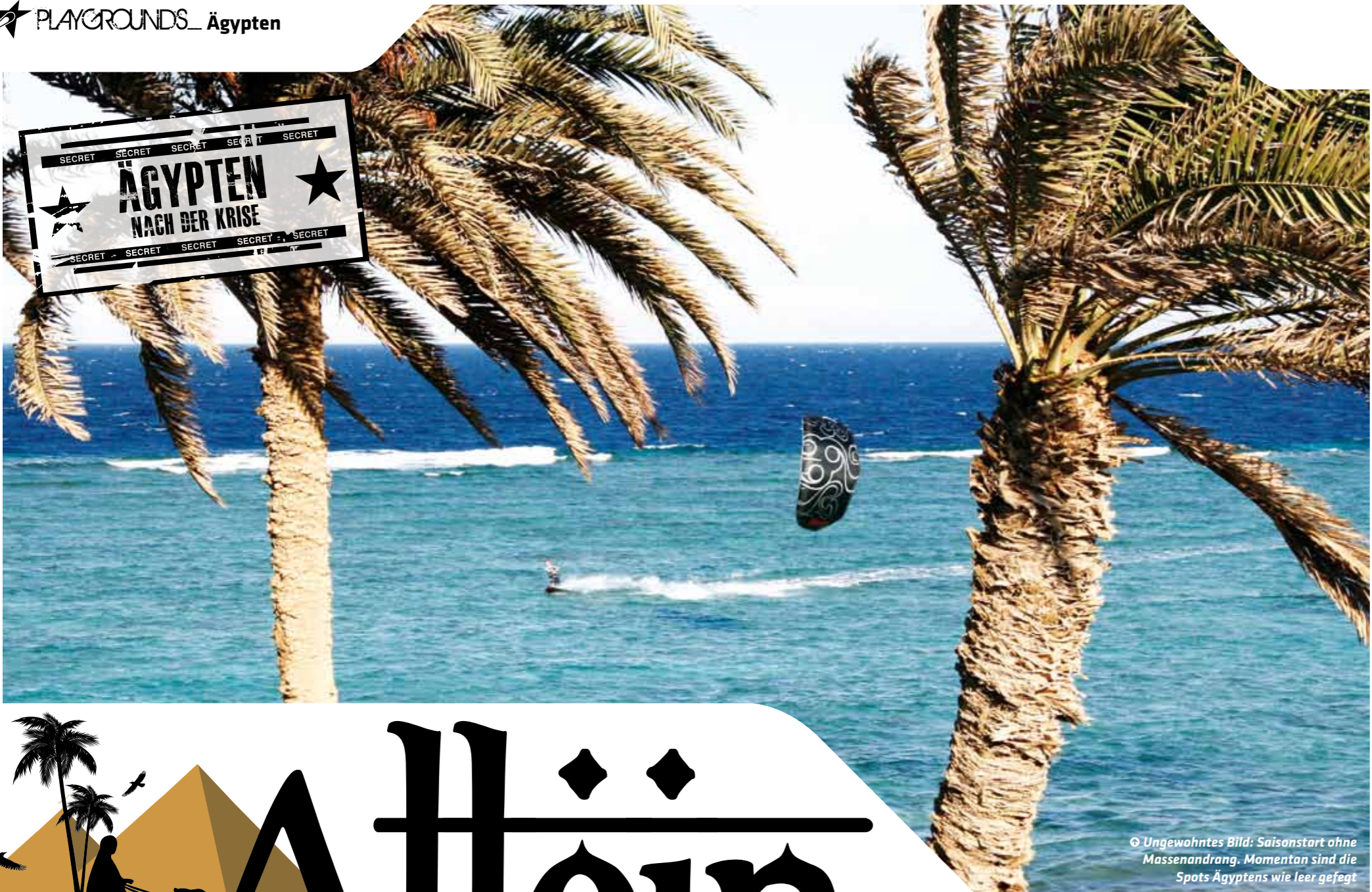
Ungewohntes Bild: Saisonstart ohne Massenandrang. Momentan sind die Spots Ägyptens wie leer gefegt